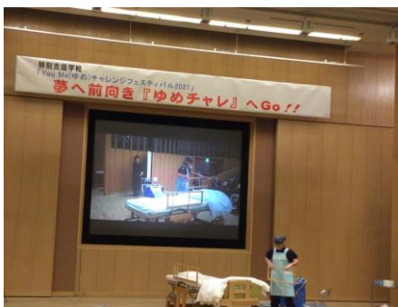
技能検定実演(シーツ回収)